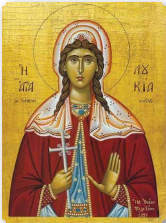
Santa Lucia vergine e martire di Siracusa (13 Dicembre)