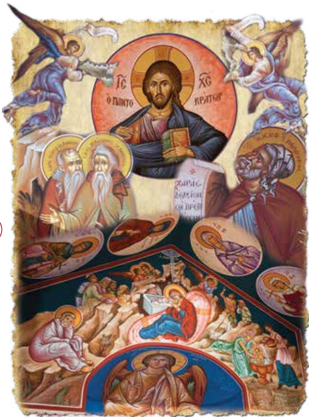
Composizione agiografica realizzata dal protopresbitero Basilio Koutsouras