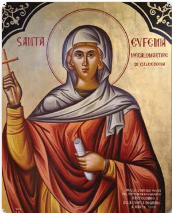
Santa Eufemia di Calcedonia Megalomartire Patrona della Sacra Arcidiocesi Ortodossa d'Italia

Icona custodita nella Basilica di Santa Eufemia a Grado (GO), donata da S.S. il Patriarca Ecumenico Bartolomeo