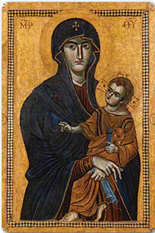
Maria SALUS POPULI ROMANI Basilica di Santa Maria Maggiore a Roma