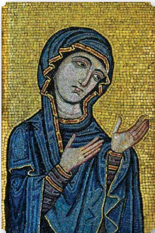
Madonna Deomene. Mosaico bizantino custodito nel Museo Ecclesiastico di Palermo.