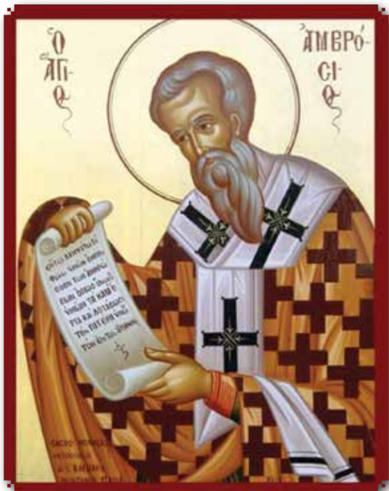
San Ambrogio di Milano (7 Dicembre)