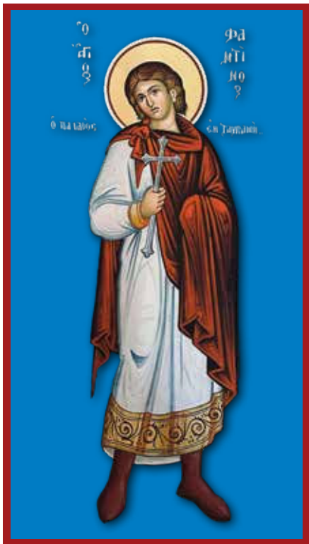
Icona di San Fantino Conservata nel Monastero Ortodosso dei SS Elia il giovane & Filarete l'ortolano. Seminara (RC)

Realizzata dal protopresbitero Basilio Koutsouras