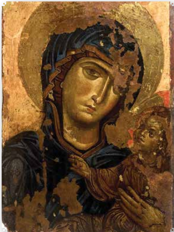
Icona della Madonna di Andria (XII secolo)