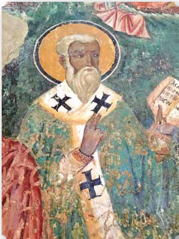
Dettaglio dall'affresco bizantino della Dormizione della Vergine. Monastero italogreco di Santa Maria di Cerrate. XI sec. Squinzano (Lecce).