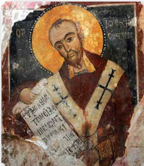
Chiesa della Madonna di Rossano Calabro. Affresco di san Giovanni Crisostomo che regge un rotolo con un'epigrafe greca.