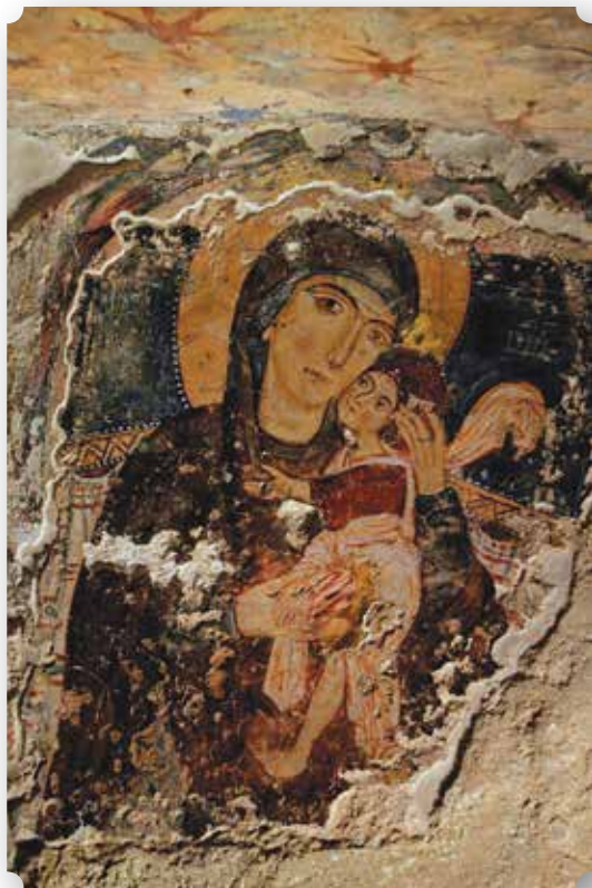
Icona Affresco bizantino della Madonna nella cripta del Crocefisso ad Ugento (Salento). XIII sec.