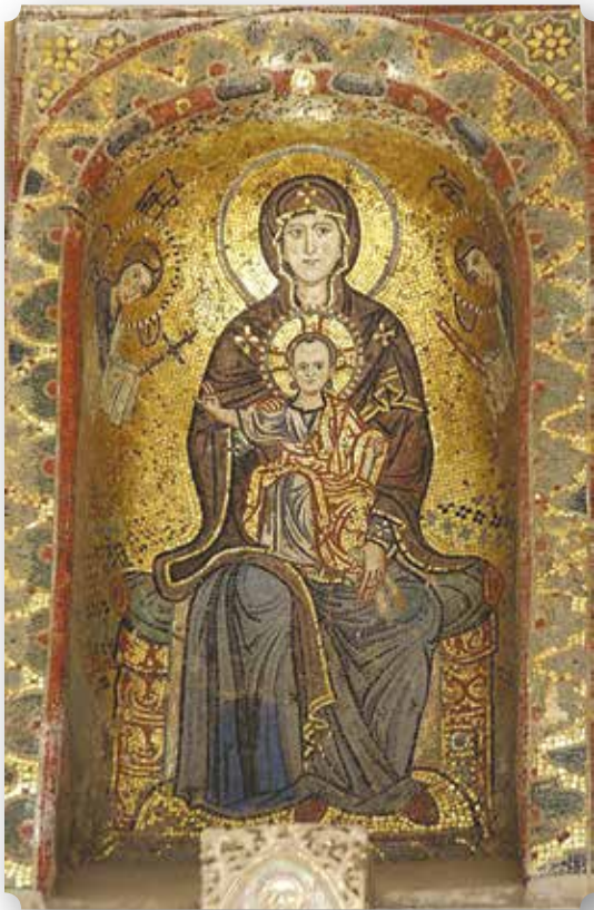
Mosaico della Madonna, risalente al XIII secolo, situato all'ingresso principale della Cattedrale di Palermo.