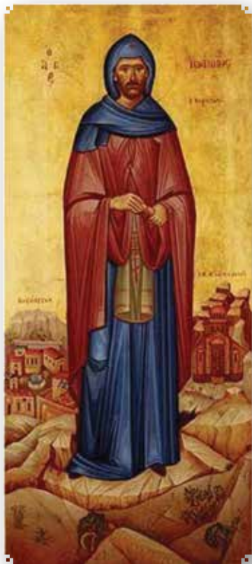
San Giovanni Theristis (24 febbraio)