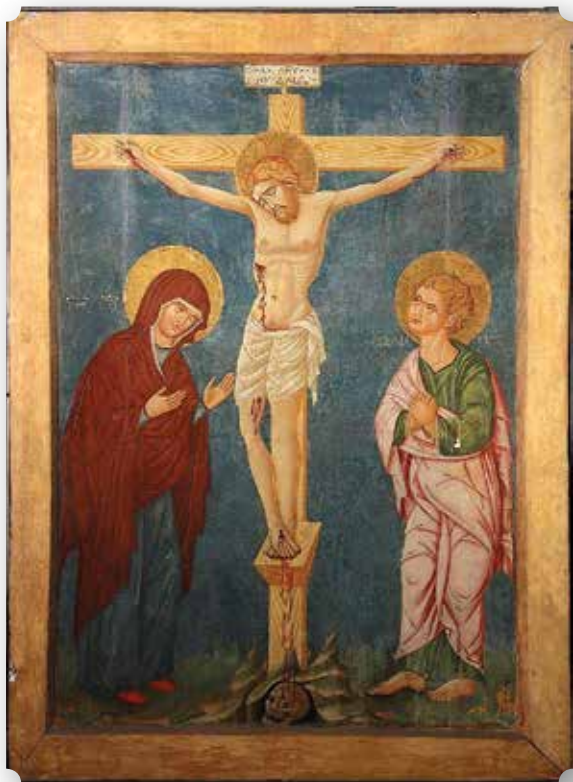
Crocifissione. Icona post-bizantina della metà del XV secolo custodita nel Museo Ecclesiastico di Rossano.