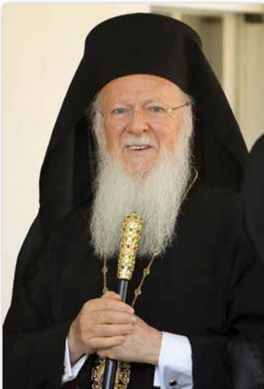
Sua Santità BARTOLOMEO

Arcivescovo di Costantinopoli-Nuova Roma e Patriarca Ecumenico