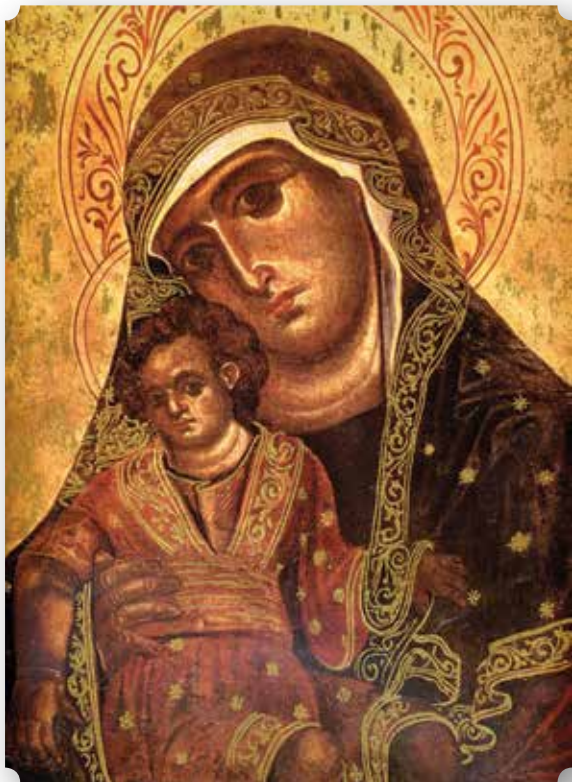
Icona della Madonna di Alemanna venerata a Gela.